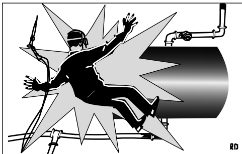
Figure 1 : explosion due à un dégazage incomplet

(De nombreux sinistres se sont en effet déclarés dans les heures suivant la fin des travaux). Si cette surveillance ne peut être assurée, cesser toute opération par point chaud au moins deux heures avant la cessation générale du travail dans l'établissement. Si possible, confier le relais de la surveillance à une personne nommément désignée pouvant accomplir des rondes.